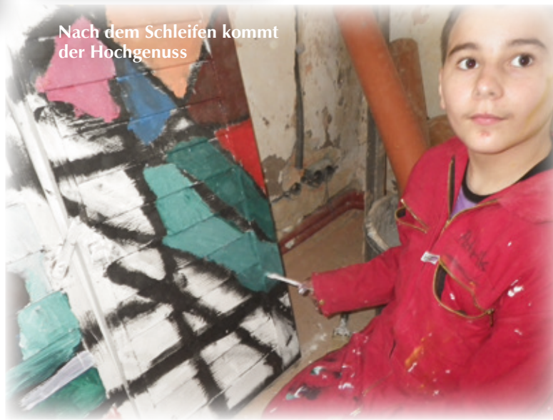
Nach dem Schleifen kommt der Hochgenuss