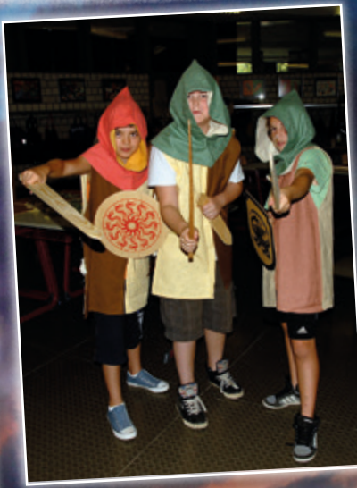
Abb. oben: Höhepunkte des Mittelaltertages waren sicherlich die Waffenkunde sowie das Armbrust- und Bogenschießen auf dem Schulhof.