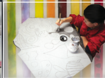
„Land Art“ der 5a