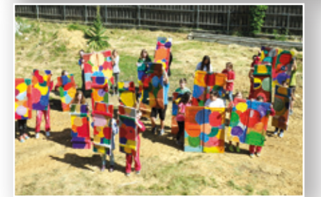
Die Fensterladen-Aktion der 5c